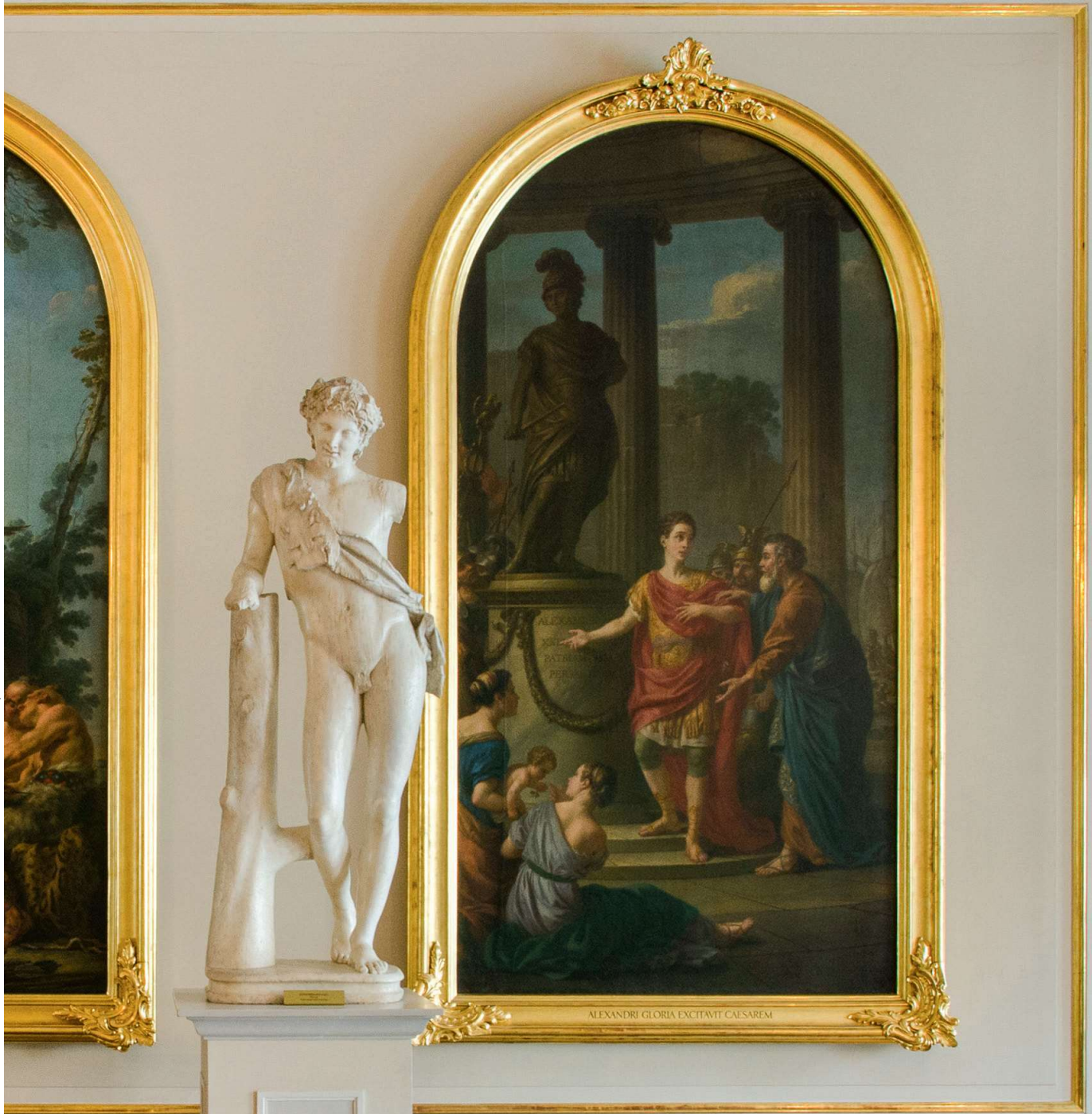
ALEXANDRI GLORIA EXCITAVIT CAESAREM